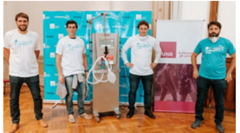
EL PROTOTIPO DE RESPIRADOR PRESENTADO EN LA GOBERNACIÓN DE SANTA FÉ. 📷

Diferentes experiencias articuladas desde facultades o por iniciativa propia de docentes y estudiantes van mostrando este camino: en la Universidad de Rosario se están desarrollando respiradores, en la facultad de Medicina de la UBA se convocó a un voluntariado y por